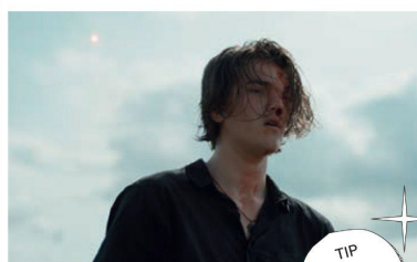
Brutální vedro pá 22. 9. 16:00 Kinosál, Měšťanská beseda

Gedeona, ať tak na první pohled vůbec nevypadá. Je velmi zábavný (i když lecky spíš podprahově), a zároveň podle mě velmi přesně vypovídá o pocitech dnešní mladé generace.