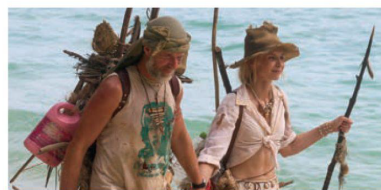
Ostrov pá 22. 9. 15:00 Malý sál, Měšťanská beseda